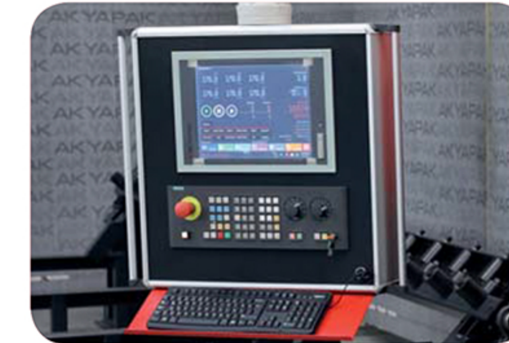
Controller Unit Kontrol Ünitesi